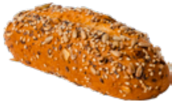
Baguette meergranen Baguette multicéréales Baguette multigrain