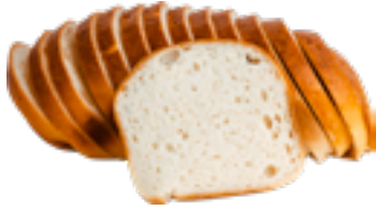
Brood wit Pain blanc White bread