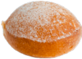
Broodjes natuur Petits pains blanc White small breads