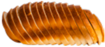
Brood wit Pain blanc White bread