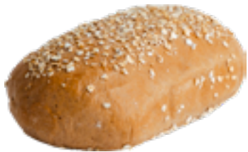
Brood haver Pain d'avoine Oat bread