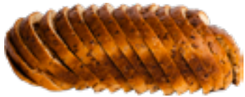
Brood meergranen Pain multicéréales Bread multigrain