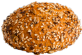
Broodjes meergranen Petits pains multicéréales Small breads multigrain