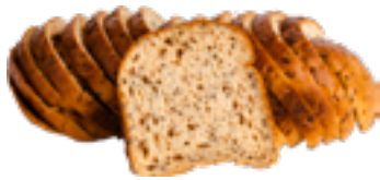
Brood meergranen Pain multicéréales Bread multigrain