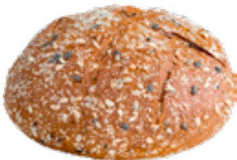
Broodjes meergranen gierst Petits pains multi millet Small breads multi millet